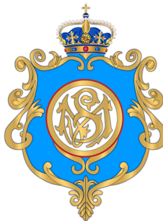
Armoiries de la Maison Souveraine princière